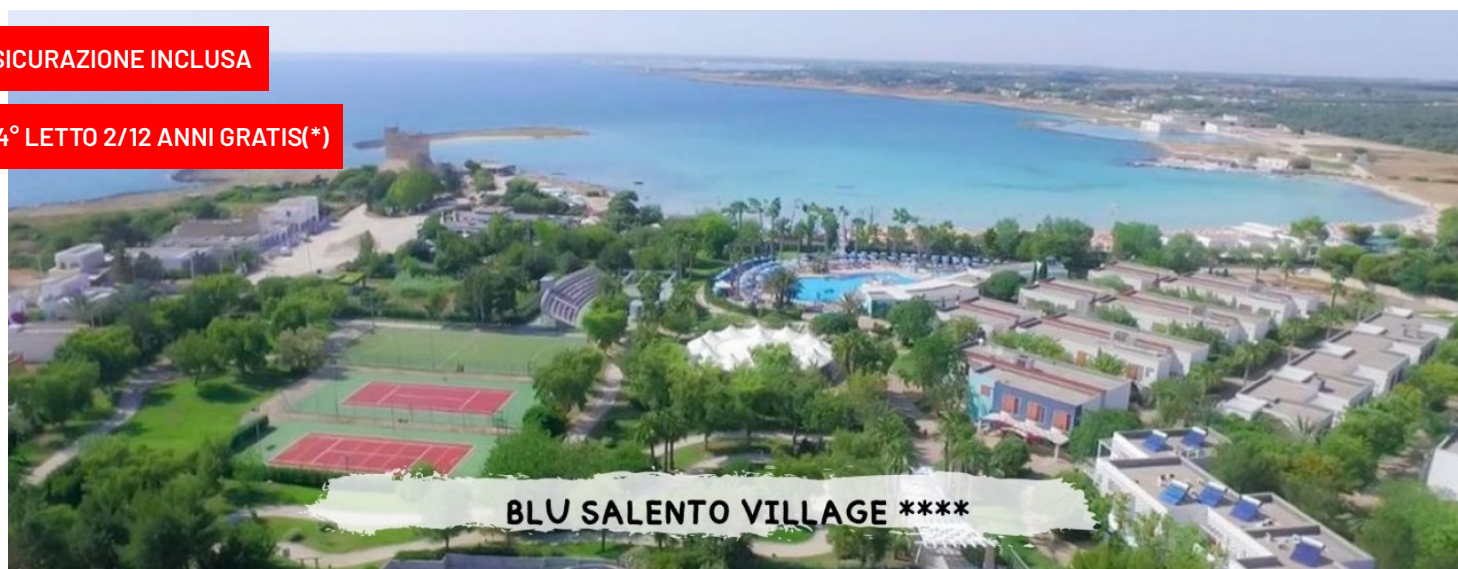
BLU SALENTO VILLAGE ****