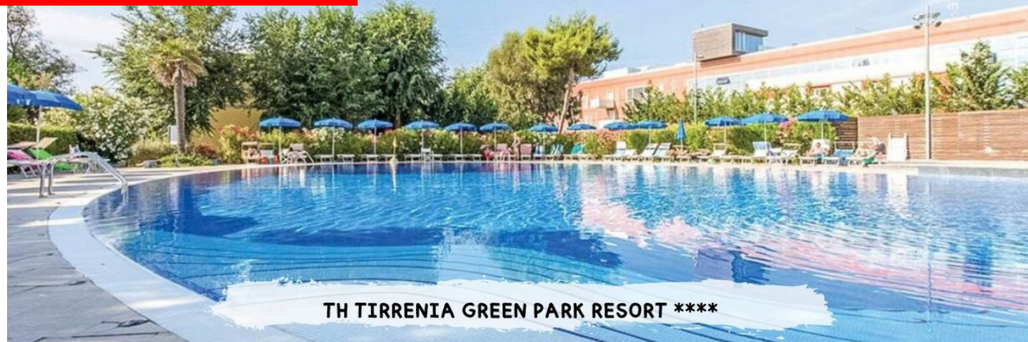
TH TIRRENIA GREEN PARK RESORT ****

PRENOTA PRIMA GARANTITO FINO AL 15 MARZO