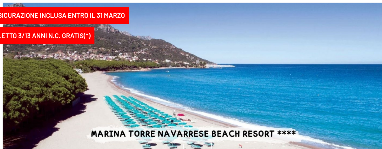
MARINA TORRE NAVARRESE BEACH RESORT ****