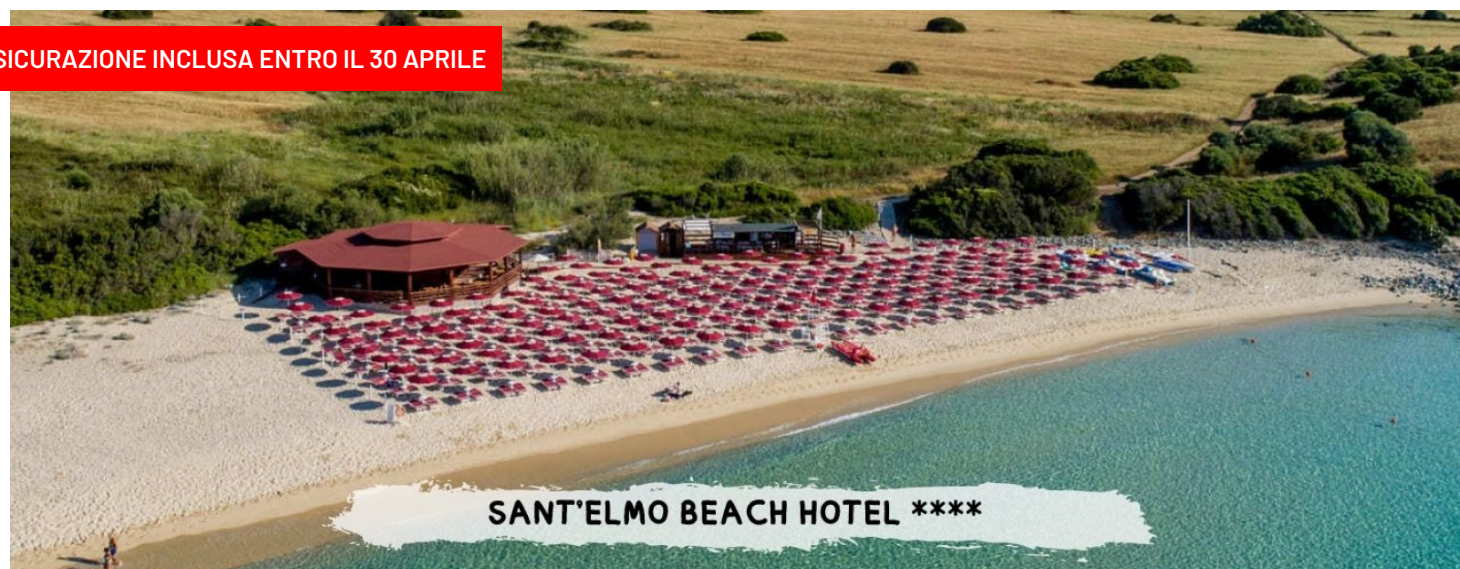
SANT'ELMO BEACH HOTEL ****

ASSICURAZIONE INCLUSA ENTRO IL 30 APRILE