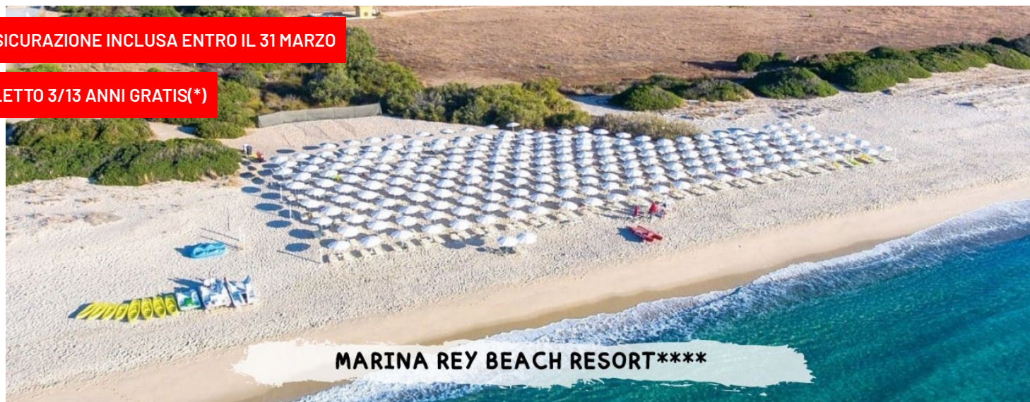
MARINA REY BEACH RESORT****

PER LE TUE SETTIMANE SPECIALI CLICCA QUI