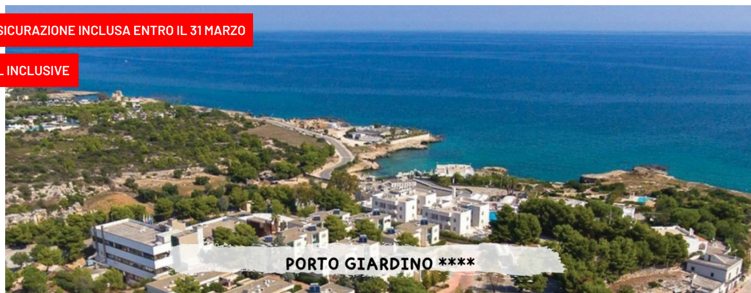
PORTO GIARDINO ****