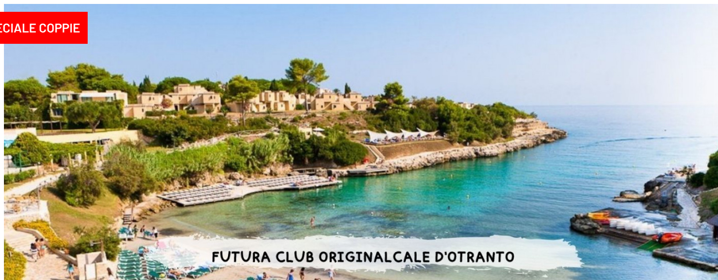
FUTURA CLUB ORIGINAL CALE D'OTRANTO