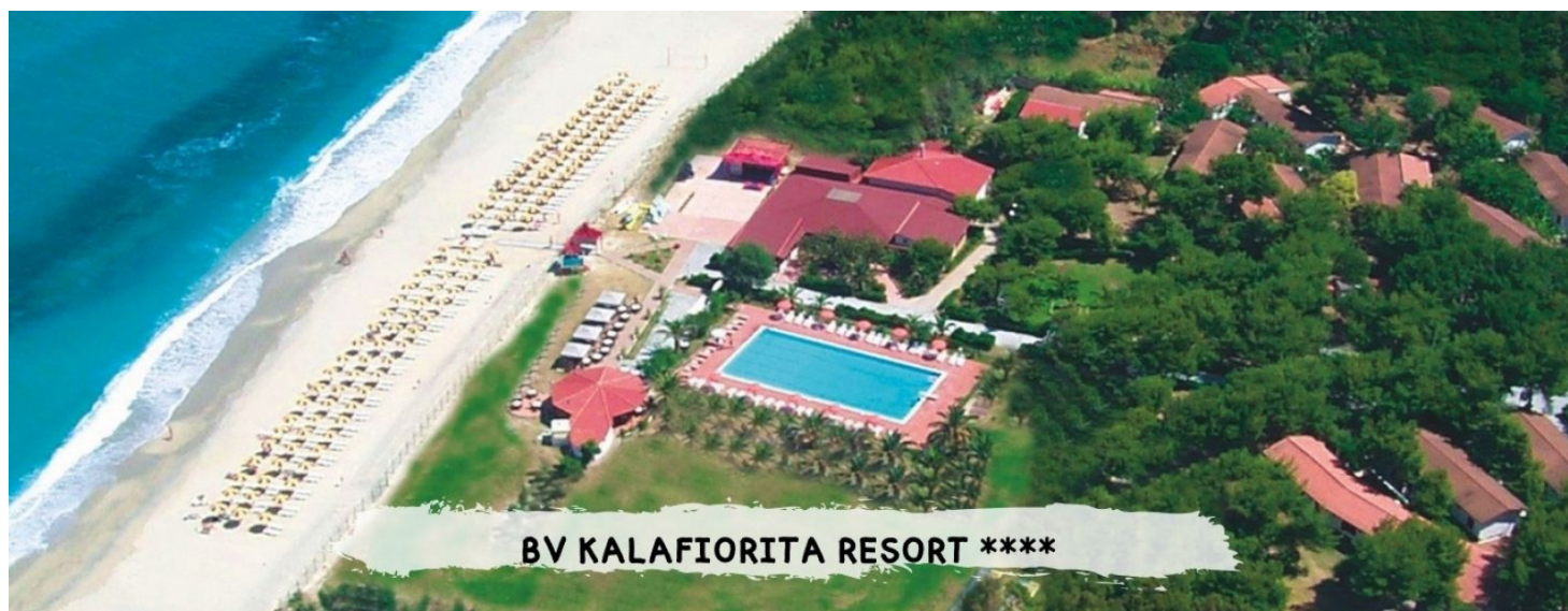
BV KALAFIORITA RESORT ****