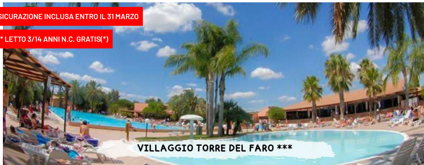
VILLAGGIO TORRE DEL FARO ***

quote a persona in pensione completa - bevande incluse in formula "mondotondo club"