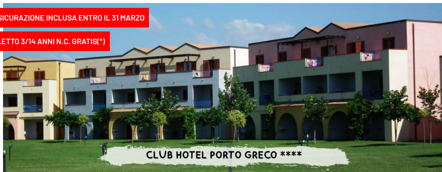
CLUB HOTEL PORTO GRECO ****

quote a persona in pensione completa - bevande incluse in formula "mondotondo club"